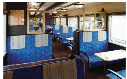
地元工芸ミニギャラリーも設置し、シックな車内空間に彩りを添えます。

内装は、能登に息づく伝統工芸や天然素材を活用。能登の旬の食を楽しめるよう、サービスカウンターを、また、全席にテーブルを設けました。能登で育まれた自然の恵みや匠の心・技を存分にご堪能ください。