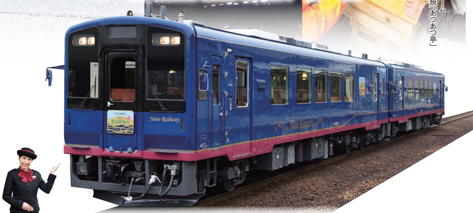
かき炭火焼「あつあつ亭」 穴水駅ホーム

能登の里山里海が織りなす風景と旬の味を楽しむ、ぬくもりと懐かしさを感じさせる観光列車。